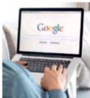
Site-specific search helps

"site:economictimes.indiatimes.com CWC 2019", you will only find CWC 2019- (or Cricket World Cup 2019-) related stories from Economic Times website.